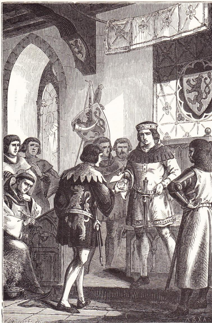
ADOLF DE BERG STAAT ZIJNE RECHTEN OP HET HERTOGDOM LIMBURG AAN JAN I VAN BRABANT AF.

bisschop van Keulen, de graven van Kleef, van Gulik, van Nassau, van Bar en eene menigte andere heeren telde, rukte in 1283, naar de Maas op (langs den kant van Valkenburg). De Brabander trok hem met den bisschop van Luik te gemoet; maar er had geen veldslag plaats